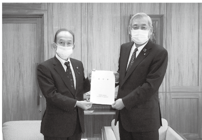
▲要望書を舟橋議長(左)へ渡す梶本会頭