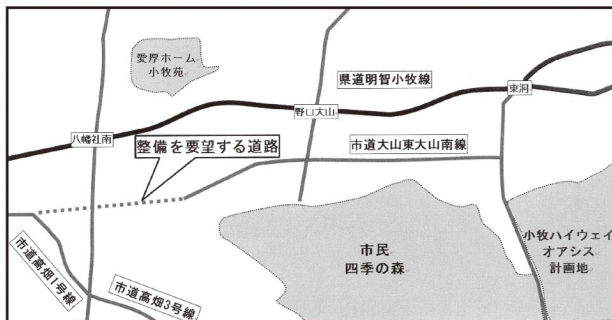
▲整備を要望する道路の略図