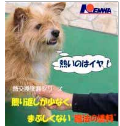
特殊塗材で創造を求めろ！

舟津 平成4年 塗装工事業 1,000万円 9名 『床の創造』の経営理念のもと、真のニーズを顧客に提供する中で、従来のコンクリート工法の強度や耐摩耗性の不足という問題点に着目。産学連携により、真空脱水処理で『余剰水』と『巻き込みエア』を短期間で吸引除去して、コンクリートの早期強度の発現や表層強度と耐摩耗性を向上させる改善工法『ベストフロアシステム』を開発。また次の成長の一手としてメーカーと『熱交換塗料』を共同開発。同塗材は“熱エネルギー”を“運動エネルギー”に変換して、熱の低減をはかる新しい塗料で、ヒートアイランド対策には有効とされている。