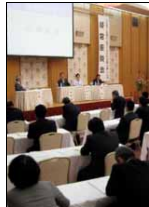
経営座談会の様子